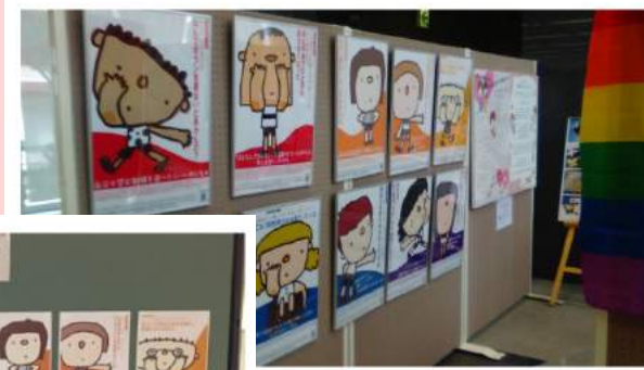
※2017年3月 広島市内でのパネル展