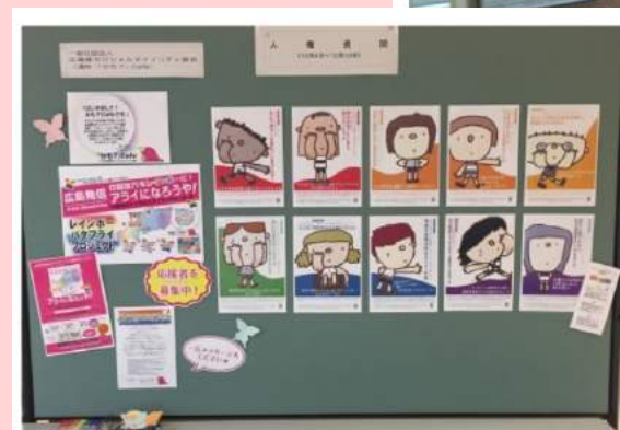
※2016年12月福山市内でのパネル展